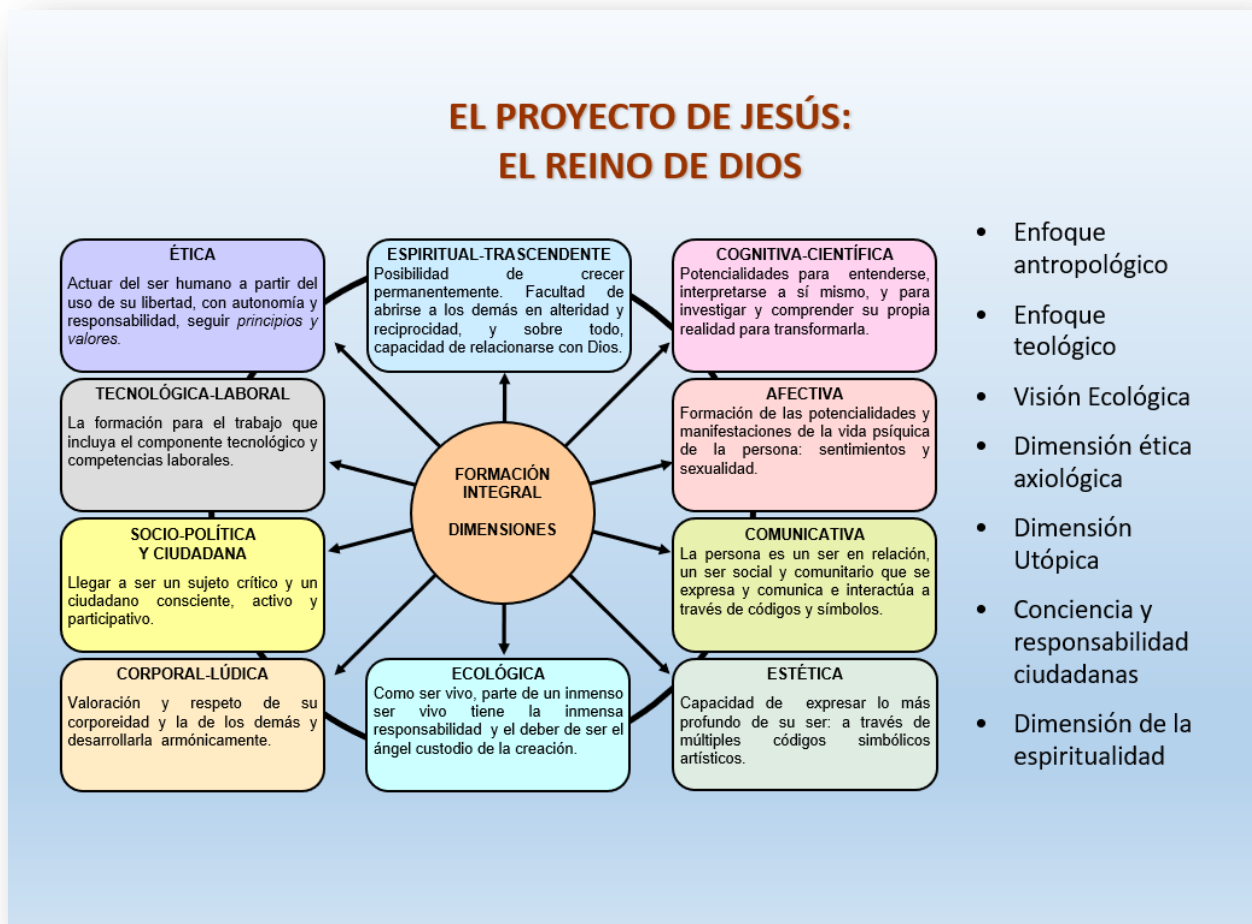
Figura 1. Dimensiones de desarrollo de los principios éticos