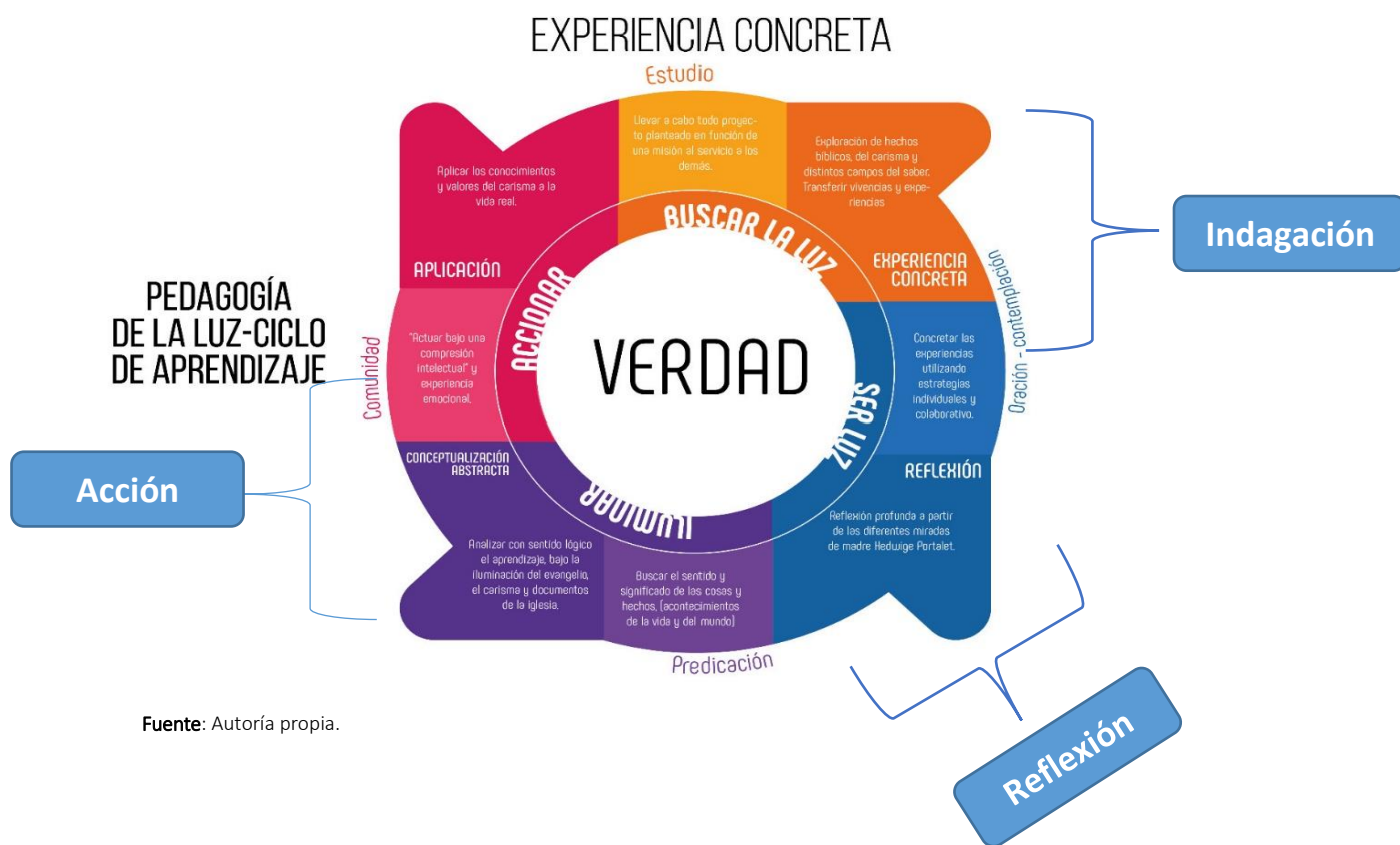
Figura 3. Pedagogía de la Luz-Ciclo de aprendizaje